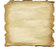
Mynd 2.1: Pappír

Pappír var fundinn upp í Kína árið 105 og barst til Arabalanda á 8. öld. Á 12. öld er farið að framleiða pappír á Spáni og síðan breiddist tæknin út, en lengi vel þótti pappírinn lélegri en skinnið. Margar bækur síðmiðalda annars staðar í Evrópu eru þó skrifaðar á pappír. Á Íslandi var pappír fyrst notaður á 15. öld. Talað er um hann í bréfi frá árinu 1423 en elsta varðveitta bréfið er frá 1437. Elsta varðveitta pappírnbókin er bréfabók Gissurar Einarssonar Skálholtsbiskups (1540–1548). Skinn var þó notað fram á síðari hluta 17. aldar. Pappírnbækur voru kallaðar codex chartaceus á latínu. Sú leturgerð sem notuð er til að skrifa íslensku og fjölda annarra tungumála nefnist latínuletur. Forsögu þess má rekja allt til Föníkíumanna, sem bjuggu við botn Miðjarðarhafsins, frá því um 1200 f.Kr. en þeir notuðu samhljóðaskrift. Af þeim lærðu Grikkir að skrifa, hófu að tákna sérhljóðana líka og löguðu stafina til á ýmsa vegu. Rómverjar lærðu svo leturlistina af Grikkjum en breyttu útliti stafa, e.t.v. svo að þeir hentuðu betur til að höggva í stein, og breyttu hljóðgildi sumra. 2